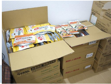
備蓄飲食料 防災食