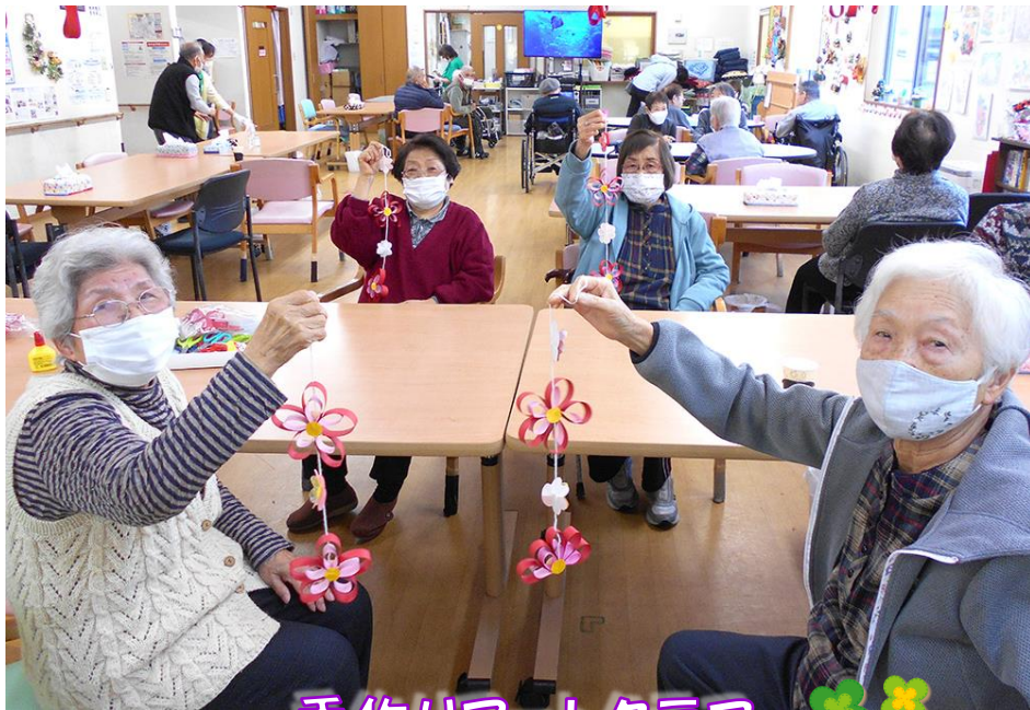
手作りアートクラブ