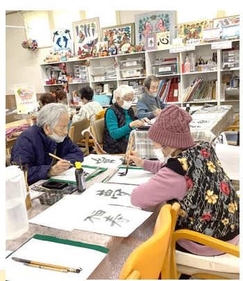
デイセンターリハビリプラザ小山

応募締め切り1月31日(水) 選考期間2月1日(木)〜2月10日(土) 結果発表3月1日(金) 賞 最優秀作品賞、役員特別賞、 金賞、銀賞、銅賞