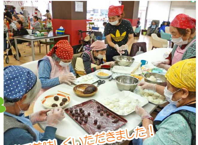
皆で美味しくいただきました!

お彼岸に調理活動でおはぎを作りました。リハビリプラザ藤井寺での恒例になりつつあるお彼岸のおはぎ作り。ご利用者が慣れた手つきで、手際よく沢山のおはぎを作ってくれました。