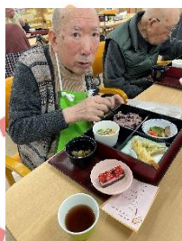
天ぷらが大人気でした♪