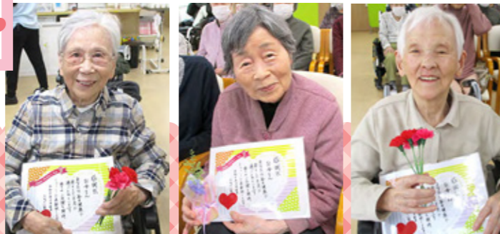
今月の特集(中面) 施設のかわいい仲間たち