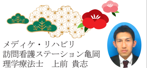
メディケ・リハビリ 訪問看護ステーション亀岡 理学療法士 上前 貴志