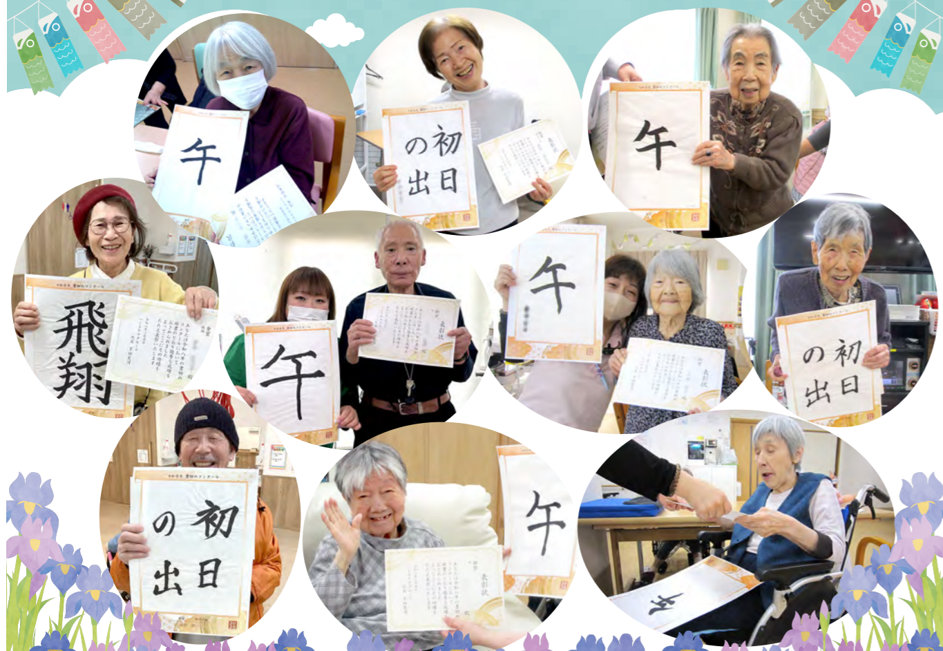
今の特集 第4回 ハートケアグループ書初めコンクール開催